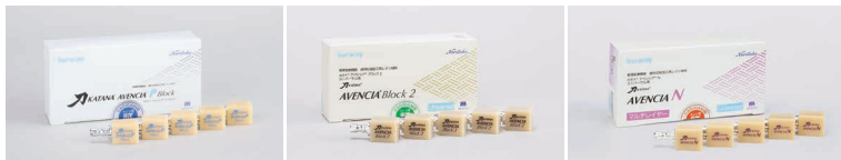
カタナ® アベンシア® Pブロック カタナ® アベンシア® ブロック 2 カタナ® アベンシア® N